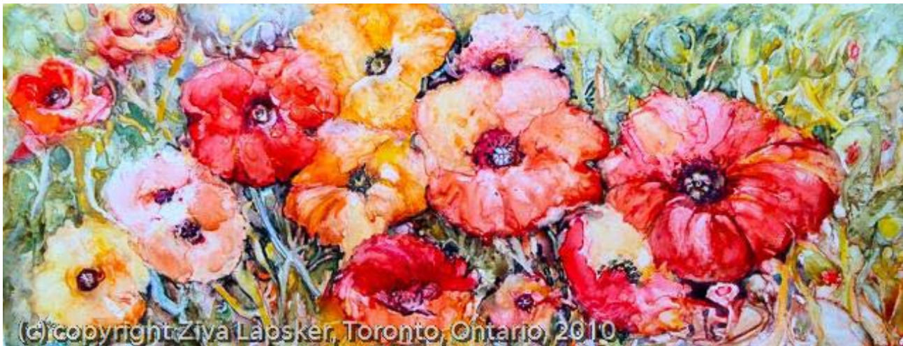
זיוה לפסקר, פרחים אדומים, צבעי מים